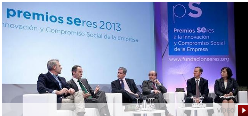
Los ganadores del Premio Seres 2013, en la entrega de galardones ayer en Madrid. | Vídeo: Óscar Chamorro

06.12.13 - 20:13 - ROSARIO GONZÁLEZ / ÓSCAR CHAMORRO (vídeo) | MADRID