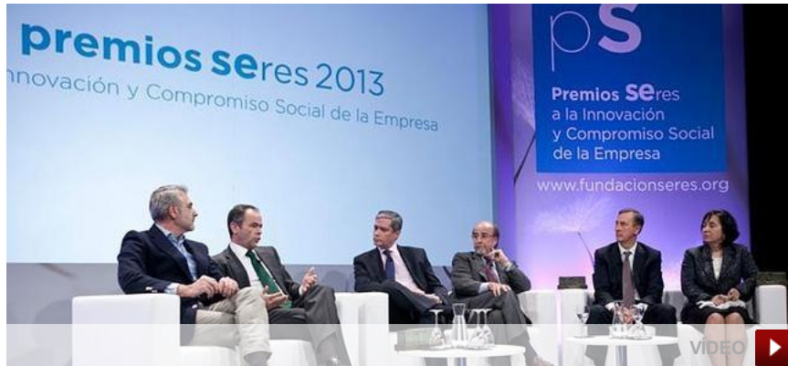
Los ganadores del Premio Seres 2013, en la entrega de galardones ayer en Madrid. Vídeo: Oscar Chamorro

06.12.13 - 20:13 - ROSARIO GONZÁLEZ / ÓSCAR CHAMORRO (vídeo) | MADRID